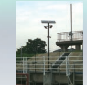
ソーラーLED街路灯 (宮城県多賀城市)