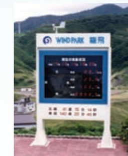
気象状況表示システム (青森県外ヶ浜町)

広報用表示板から気象観測などの特殊な分野まで、様々な用途の表示システムをご提供いたします。