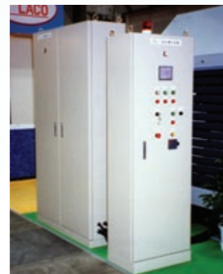
リサイクル制御盤