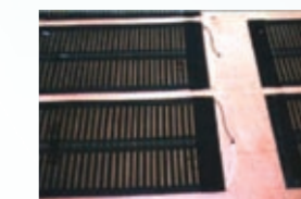
EPヒーターエレメント

EPヒーターエレメントは、自己温度調整機能内蔵の平板発熱体です。厚さがたったの3mmで、敷いて固定するだけでどんな場所でも簡単に施工ができます。また、低電圧で駆動するので感電の危険が一切ございませんので、あらゆる融雪や暖房にご利用できます。