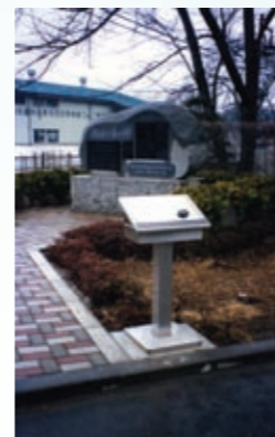
オートサウンドシステム (岩手県奥州市)