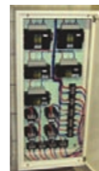
力率改善用コンデンサ