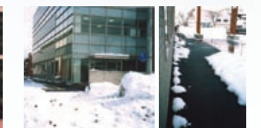
融雪設備(青森県弘前市)