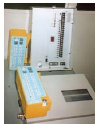
ハンディテレメータ コントロールシステム