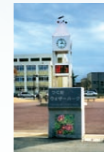
気象情報表示システム (青森市)