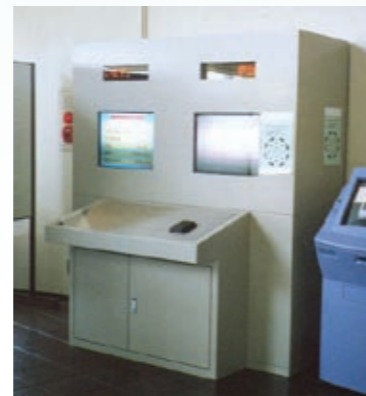
水質データ測定装置 (宮城県伊豆沼・内沼サンクチュアリセンター)