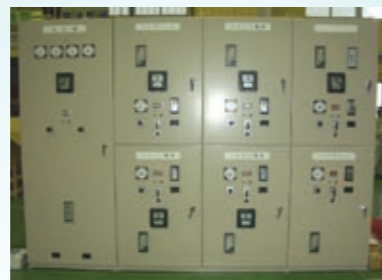
高圧キュービクル