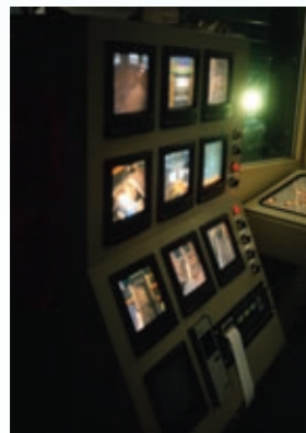
プラント監視システム